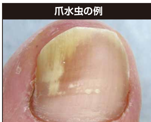
爪が白色や黄色に濁ったり、厚くなってぼろぼろと欠けたりする